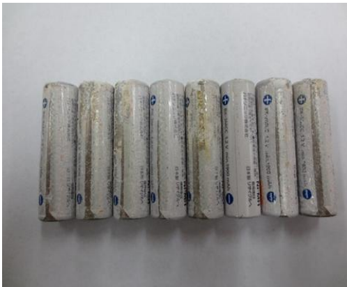
部分的な取り替えにより破損した例

エネループのようなNi-MH 充電電池をお使いの際は、必ず全数同時充電、全数同時取り替えをお願いいたします。一部のみの取り換えは充電電池の特性上、発熱や充電電池の破裂のおそれがあります。